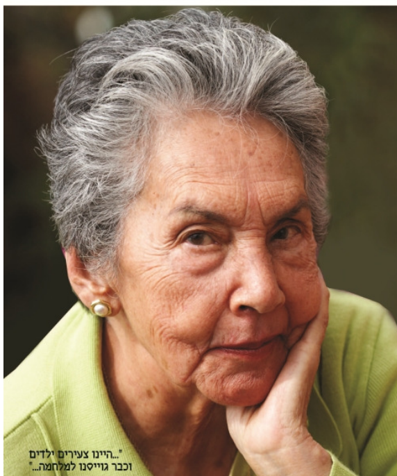
"...היינו צעירים ילדים וכבר גוייסנו לעלמנה..."